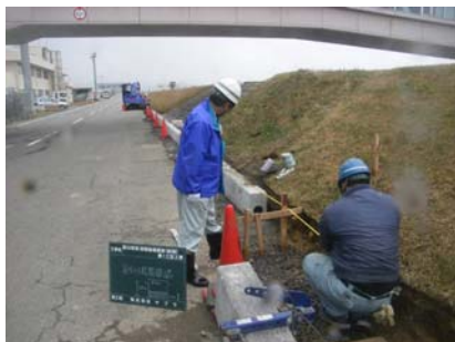
消雪ブロック据付確認

富山空港では、老朽化した消雪配管設備の更新、誘導案内灯の周辺に消雪設備を設置する工事が施工されました。センターでは、これらの工事の設計積算・施工管理を受託しました。飛行機発着に伴う時間規制の中での工事のため、夜間施工を基本としていますが、夜間段階確認を行うなど、適切な施工管理に努めました。