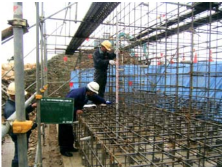
橋台工鉄筋の確認

この工事は、立山・上市横断道路のうち、立山町で整備中の栃津川に新設する橋梁下部工を含めた延長 480m の区間における道路改良工事です。センターでは工事の設計積算・施行管理を受託しています。栃津川における橋台及び護岸の施工は、河川管理者及び漁業関係者による工事期間の制限があるため、工事の遅れがないように注意しながら施工管理を実施しています。