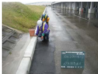
散水ノズル調整状況