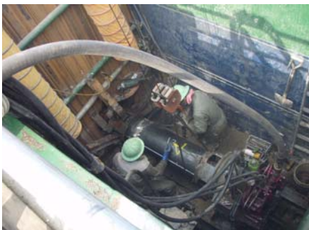
推進工法の施工状況

中新川広域行政事務組合は、計画的に下水道整備の工事を発注しており、当センターでは毎年数件の工事について設計積算・施工管理を受託しています。今年度は立山町5件、上市町3件の工事を受託しました。立山町の工事には、釜ヶ淵用水を横断する箇所における推進工法 (φ400 鋼製さや管推進L=7.0m) も含まれており、用水の漏水等がないか注意しながら施工管理を実施しました。