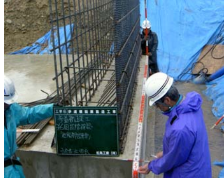
管渠側壁鉄筋工確認