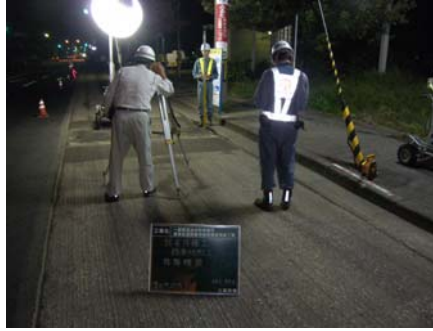
切削高さ(厚さ)確認