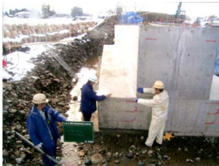
橋台工躯体の確認