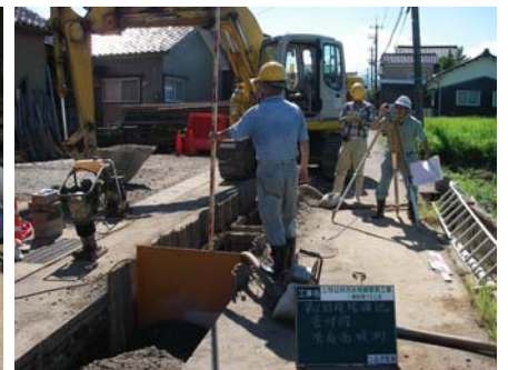
下水管の管底高確認