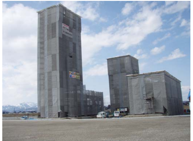
県消防学校・防災拠点施設の建築工事 平成 23 年 3 月