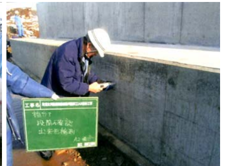
躯体コンクリートの強度確認