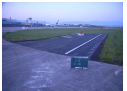
誘導案内灯付帯施設完成