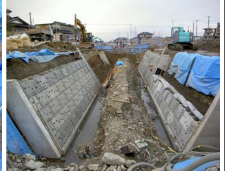
護岸工(祖父川上流側より)