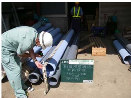
下水管 (PRP φ200) の材料検収