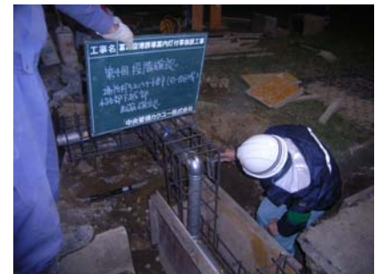
現場打ち配管部の確認