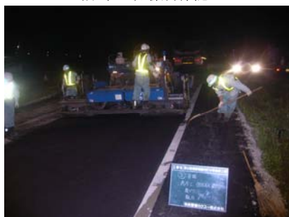
アスファルト舗装の夜間施工状況