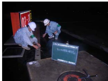
散水ノズルの確認